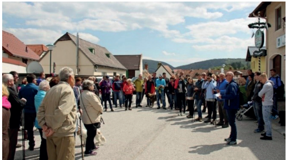
Heimatkundewanderung in Hernstein und Grillenberg

Geschichte von Hernstein brachten (vom Naturdenkmal aus der Keltenzeit, über die Herrschaft der Falkensteiner, den Kirchengeschichten, dem Bergbau in Grillenberg und Neusiedl bis zur Pecherei in der jüngeren Geschichte).